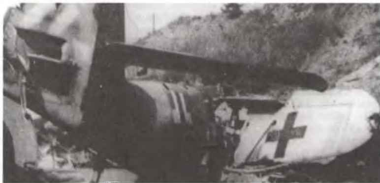
Разлік сяржанта М. Бычынскага (крайні злева) і збіты ім самалёт.