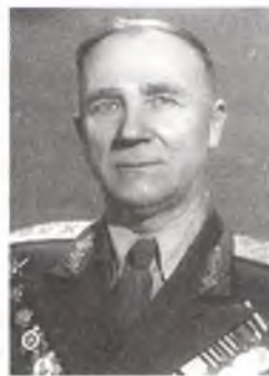
Ф. А. Кандыдатаў.

сустрэў у Прыбалтыцы ў званні капітана, а скончыў генерал-маёрам у Германіі, на Эльбе. За час вайны Ф.А.Кандыдатаў быў узнагароджаны ордэнамі Леніна, 4 Чырвонага Сцяга, 2 Чырвонай Зоркі, Суворова, Кутузава, Айчынай вайны і нават амерыканскім ордэнам. Памёр Ф.А.Кандыдатаў 2.2.1981 г. у Мінску.