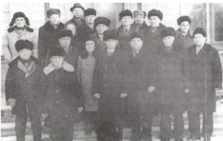
Здымак на памяць. У час адной з сустрэч партызан 42-га, 48-га атрадаў і падпольшчыкаў. Люты 1976 г.

Произведено 12 засад по Варшавскому шоссе на перегоне Чериков—Пропойск. 22 случая минирования полотна шоссе и дорожки. Спущены под откос 4 воинских эшелона с живой силой и техникой противника. Взорвано 900 метров рельс. В основном велись бои из засад на перегоне Чериков—Пропойск по Варшавскому шоссе. На засаду выделялся один взвод 40—45 человек с 6 пулемета-