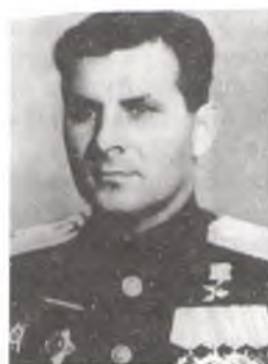
Дз. В. Чумачэнка.

Друкуецца па кн.: Шомоди В.Э. Маршрутамі народнай славы. Мн., 1988. С. 74–75 1 .