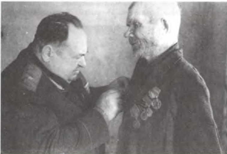
Генерал В.А.Канавалаў і Н.Ц.Коршыкаў.

натавяровачны заводы, швейную і шавецкую майстэрні, кінатэатр, бальніцу, 2 сярэднія школы. Злая нянавіць кіпіць да нямецкай гадзіны ў сэрцах людзей. З першага дня вызвалення насельніцтва Прапойска энергічна ўзялося за аднаўленне свайго горада. Пад кіраўніцтвам раненых партыйных і савецкіх органаў прапайчане рамантуюць жылыя дамы, устаўляюць тэлефонную сувязь, рамантуюць дарогі, робяць масты для пасяховага руху на захад наступачай Чырвонай Арміі. У горадзе пачала працаваць амбулаторыя, пошта, ужо арганізаваны