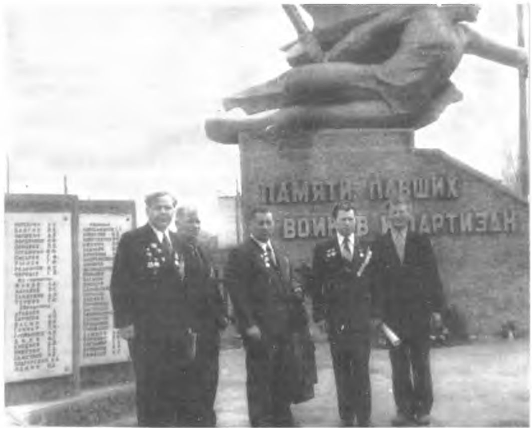
Каля помніка савецкім воінам у в. Бярозаўка.

Брацкая магіла савецкіх воінаў, якія загінулі восенню 1943 г. пры вызваленні