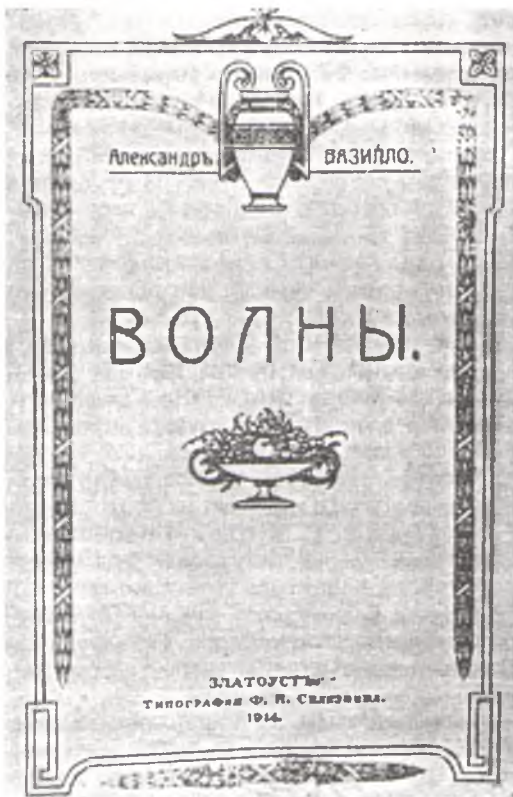
Вокладка кнiгі А.Вазiлы «Хвалi», выдадзенай у Златаусце ў 1914 г.

независимая Белорусская Республика!» Левая сторона подавленная, не понимая, что совершается вокруг, сидела молча, затаив дыхание. Такой момент был готов, когда только правая часть, незалежники, не считаясь с голосом крестьянства, сделали попытку отделения от России Белорусского края и, следовательно, непризнание Советской власти».