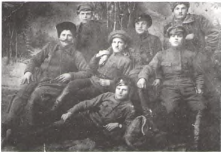
Камандны склад 6-й прапойскай роты.