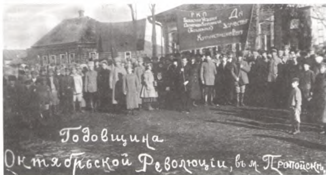
Святкаванне 1-й гадавіны Кастрычніцкай рэвалюцыі ў Прапойску. 8 лістапада 1918 г.

Паўсядзённы клопат павятовы рэўком праяўляў аб дзейнасці падпольных груп, што засталіся на правабярэжжы. А ў пачатку жніўня 1918 г. на партыйнай канферэнцыі падполь-