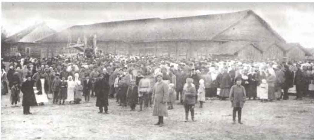
Мітынг у Прапойску. 1918 г.