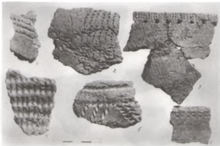
Фрагменты пасудзін эпохі неаліту, знойдзеныя ў час археалагічных раскопак каля в. Дубна.

вугольнай формы. Яго памеры 2x2,25 і 1,75x2,85 м.