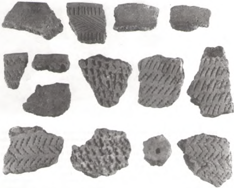
Фрагменты лянных пасудзін эпохі неаліту і бронзавага веку, знойдзеныя каля в. Кліны.

керамікі), са з'яўленнем якіх на прасторах Еўропы адбыліся значныя перамены. Яны прынеслі з сабой навыкі земляробства і жывёлагадоўлі, выраблялі баявыя сякеры і ўпрыгожвалі свой посуд адбіткамі шнура.