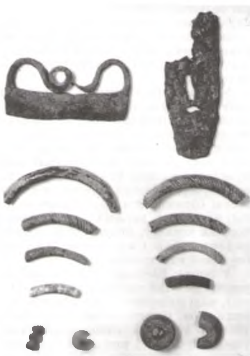
Археалагічныя знаходкі з гарадзішча Замкавая гара ў Слаўгарадзе: крэсівы, фрагменты шклянных бранзалетаў, шклянныя пацеркі, шыферныя прасліцы.

Шматразова засялялася найбольш вядомае слаўгарадчанам гарадзішча ў самім горадзе. Завецца яно Замкавая гара. Размешчана на высокім правым беразе Сожа, каля вусця р. Проня (зараз у гарадскім парку). Пляцоўка памерам 40x95 м выцягнута з поўдня на поўнач. Вышыня над узроўнем ракі каля 30 м. Шырынёй каля 20 м, глыбінёй 11 м. З заходняга боку ўмацавана ровам. У 1967 г. Г.В.Штыхаў, у 1974 г. М.А.Ткачоў, у 1988 г. А.А.Мяцельскі правялі на гарадзішчы раскопкі. Перамешаны культурны пласт месцамі дасягаў 1,8 м і ўтрымліваў матэрыялы эпохі неаліту, розных культур жалезнага веку і Кіеўскай Русі. Выяўлены драўляныя ўмацаванні ў выглядзе частакола X—XI ст. Не раней XII ст. быў зроблены земляны вал з драўлянымі сценамі —