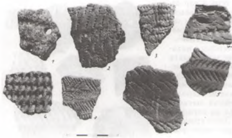
Фрагменты ляпных пасудзін, знойдзеныя ў насыпах курганоў каля в. Дубна.

У сярэдзіне 2-га тысячагоддзя да н.э. Пасожжа засялілі плямёны сосніцкай культуры (сярэдні бронзавы век). Насельніцтва вырабляла кераміку цюльпанападобнай слоікавай формы. Пасудзіны былі пласкадонныя з шырокім горлам і тулавам, якое звужалася ў ніжняй частцы. Зрэдку арнаментавалася ўся паверхня, часцей — верхняя частка гаршкоў. Пад венчыкам рабілі шэраг ямак, зусім такіх, як у неаліце. Асноўнымі элементамі арнаменту былі адбіткі кропкавага штампа і ланцужок цыліндрычных накалаў. Зрэдку наносілі адбіткі шнура і буйнога грэбеня. Вельмі характэрныя сэрцападобныя з чарашком наканечнікі стрэл. Рэшткі такога посуду і адзінкавыя наканечнікі сустракаюцца і на помніках Слаўгарадчыны.