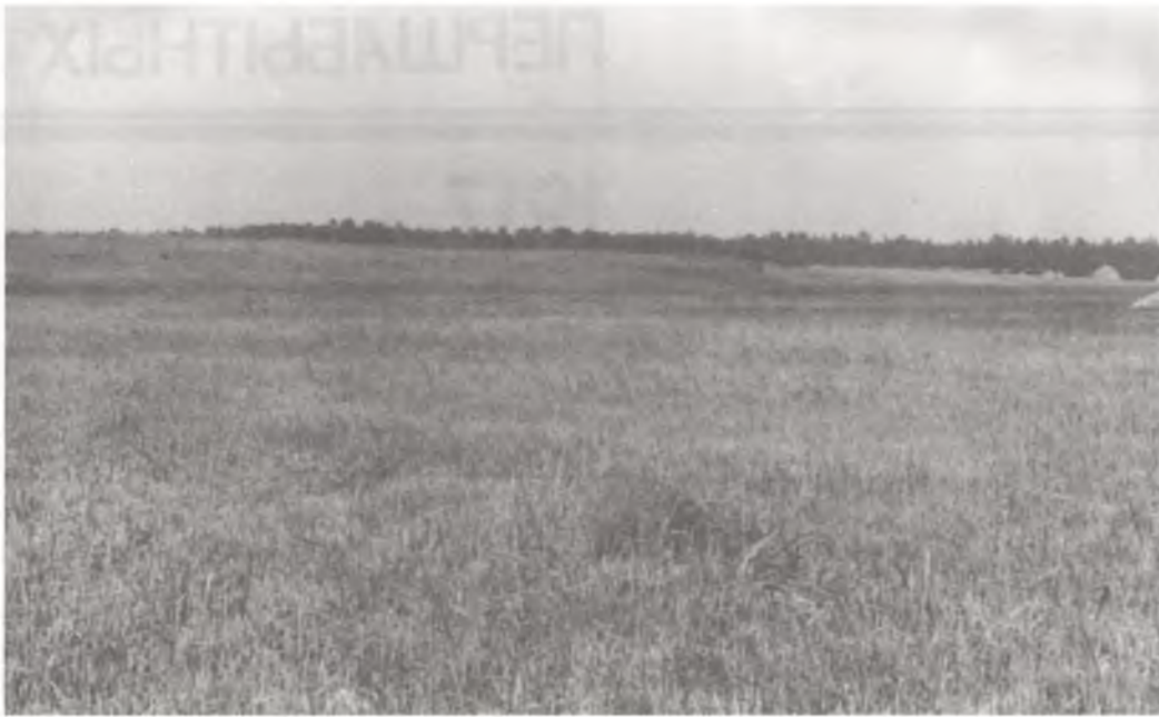
Мезалітычнае паселішча каля в. Кліны.

ды нейкая частка таго, што належала і чым карыстаўся чалавек у пэўны адрэзак часу на пэўнай тэрыторыі. Рэканструюваць гэтыя рэшткі і на аснове іх аналізу аднавіць асноўныя рысы сацыяльна-эканамічнага развіцця тых ці іншых старажытных плямён — задача археолага. З гэтых сціплых урывачных звестак з мінулага і складаецца гісторыя далетапіснага часу.