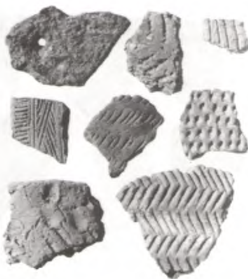
Фрагменты пасудзін бронзавага веку, знойдзеныя ва ўрочышчы Курган каля в. Рудня.

дзены і ва ўрочышчы Сасновая Грыва (Саснавец) каля в. Старая Каменка.