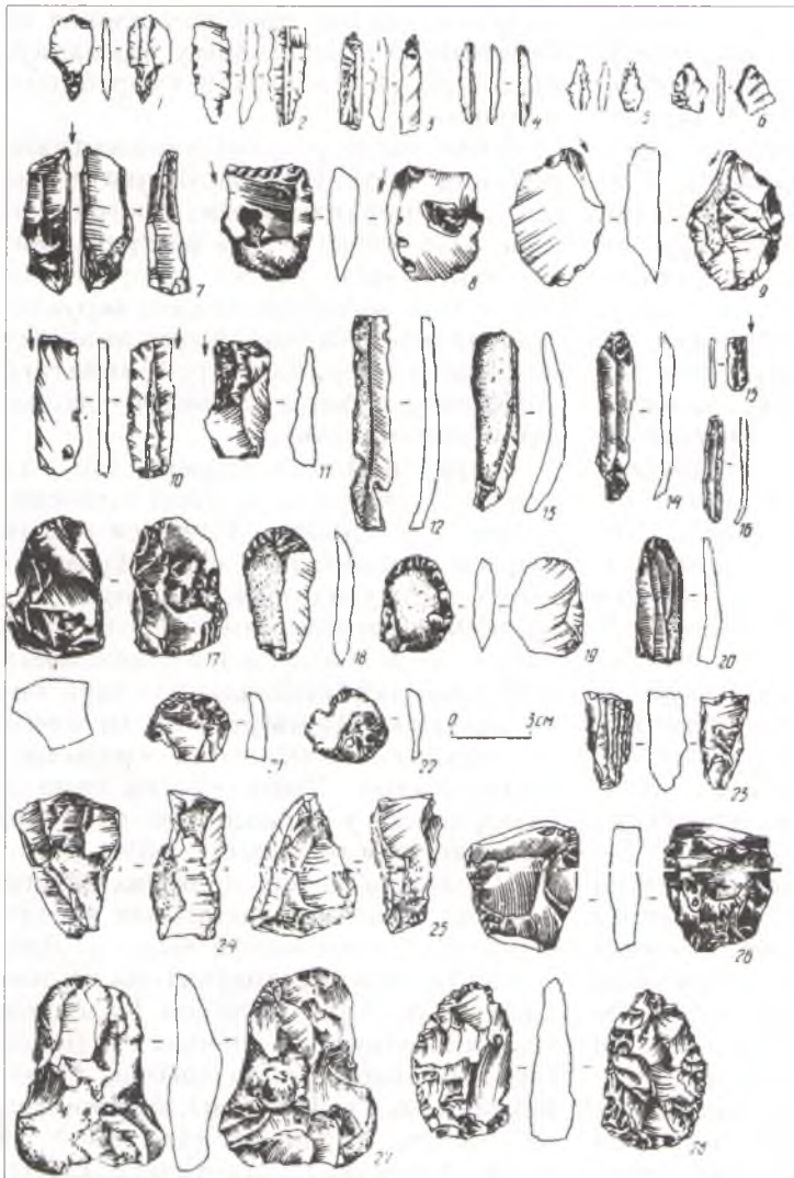
Крамянёвыя прылады працы са стаянкі каля в. Кліны.

бераг, Цёмная Грыва, або Бубенцы; каля воз. Дрышцава, Башарына поле, Сасновая Грыва, або Саснавец, Жураваўка, Завань (в. Старая Каменка).